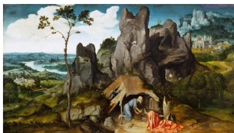
Joachim Patinir (vers 1480-1524), Saint Jérôme dans le désert , vers 1515-1520, huile sur panneau de bois, H : 78 cm, L : 137 cm. Paris, musée du Louvre.