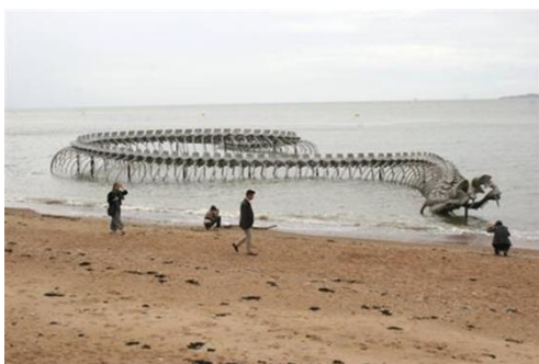
Huang Yong Ping (1954-2019), Serpent d'océan , 2012, aluminium, sculpture monumentale, L. : 128 m, H. : 3 m, création pérenne dans le cadre du parcours Estuaire. Saint-Brevin-les-Pins, Pointe de Mindin, Loire-Atlantique.