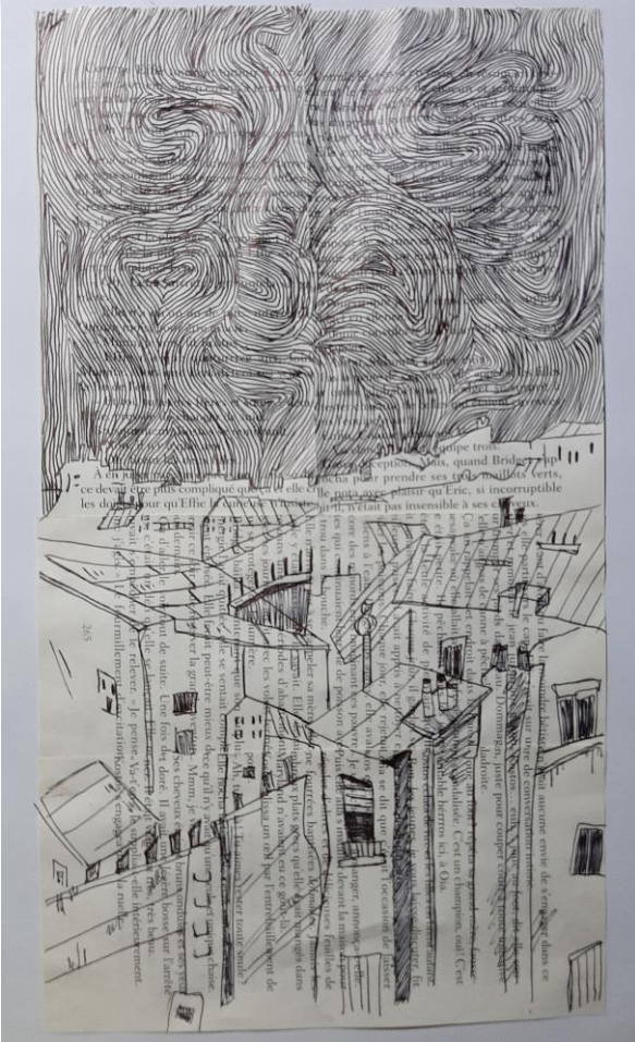
Gabrielle, 2 nd