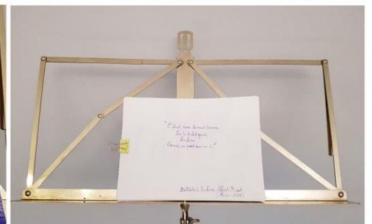
Océane, 2 nd