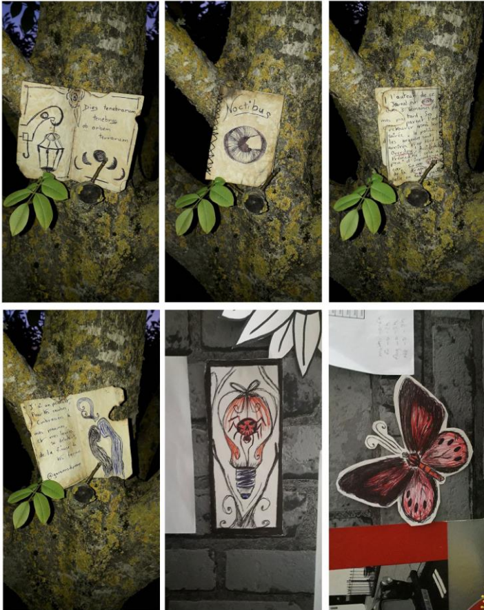
Océane, 2 nd