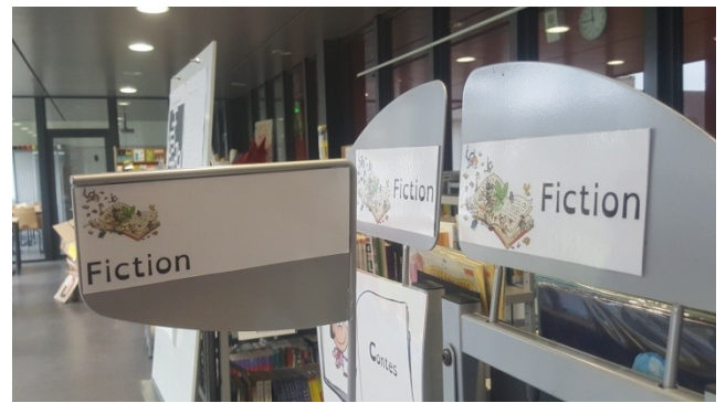
Signalétique du rayon fiction