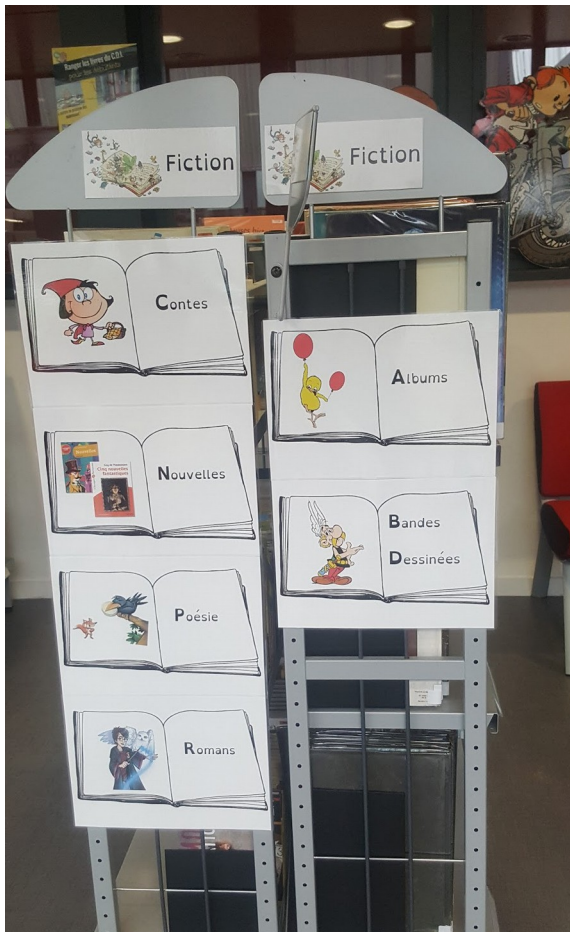
Signalétique du rayon fiction