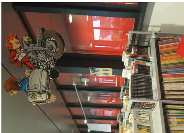
Signalétique au-dessus des Bandes Dessinées