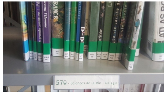
Nouvelles cotes des documentaires