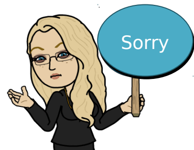
Affichage « Le CDI est fermé »