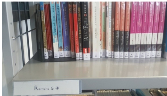
Nouvelles cotes des fictions