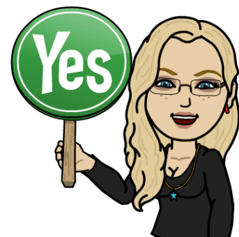
Affichage « Le CDI est ouvert »