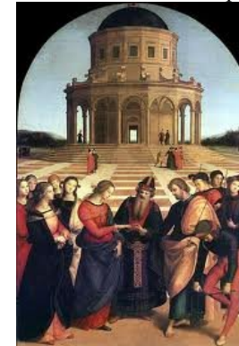
Raphaël – Le mariage de la vierge - 1504

La perspective « centrale » avec point de fuite