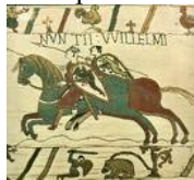
La tapisserie de Bayeux (XIe)

La « disparition » des éléments cachés par le premier plan