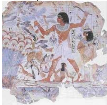
Scène de chasse et de pêche (1500 av J-C)

La perspective symbolique Les personnages les plus importants sont plus grands que les autres