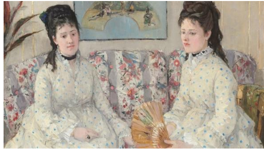
Berthe Morisot, Les Soeurs, 1869