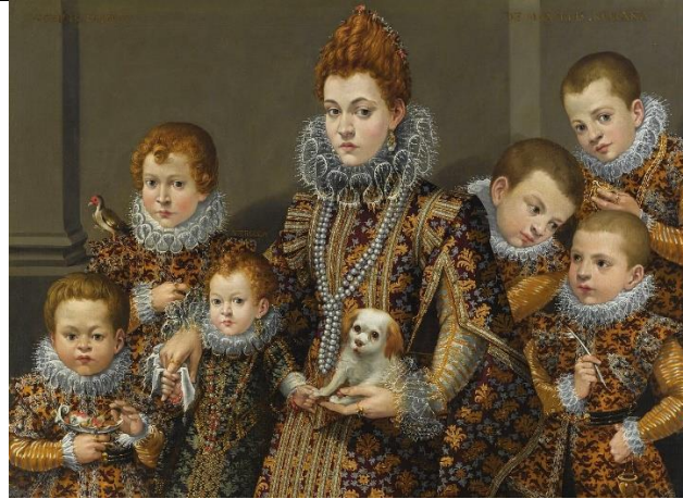
« Portrait de Blanca degli Utili Maselli avec six de ses enfants » par Lavinia Fontana (XVIème)