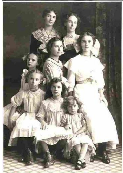
Portrait de famille 1912 Photographie