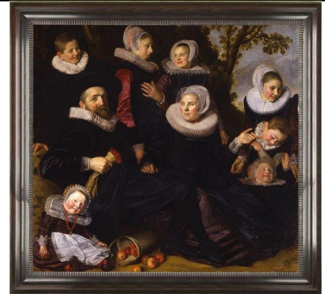
Frans Franchoisz Hals - XVIIème