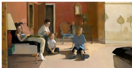
Familles, huiles sur toile – Antoine Vincent (peintre à Chartres)